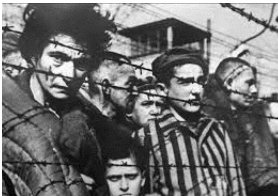
Häftlinge am Tag ihrer Befreiung