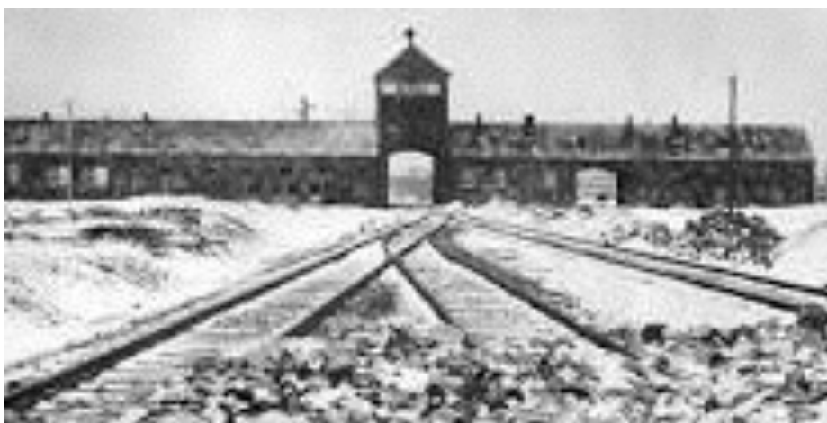
Einfahrtsgebäude des KZ Auschwitz mit zurückgelassenen Gegenständen der Wachmannschaften